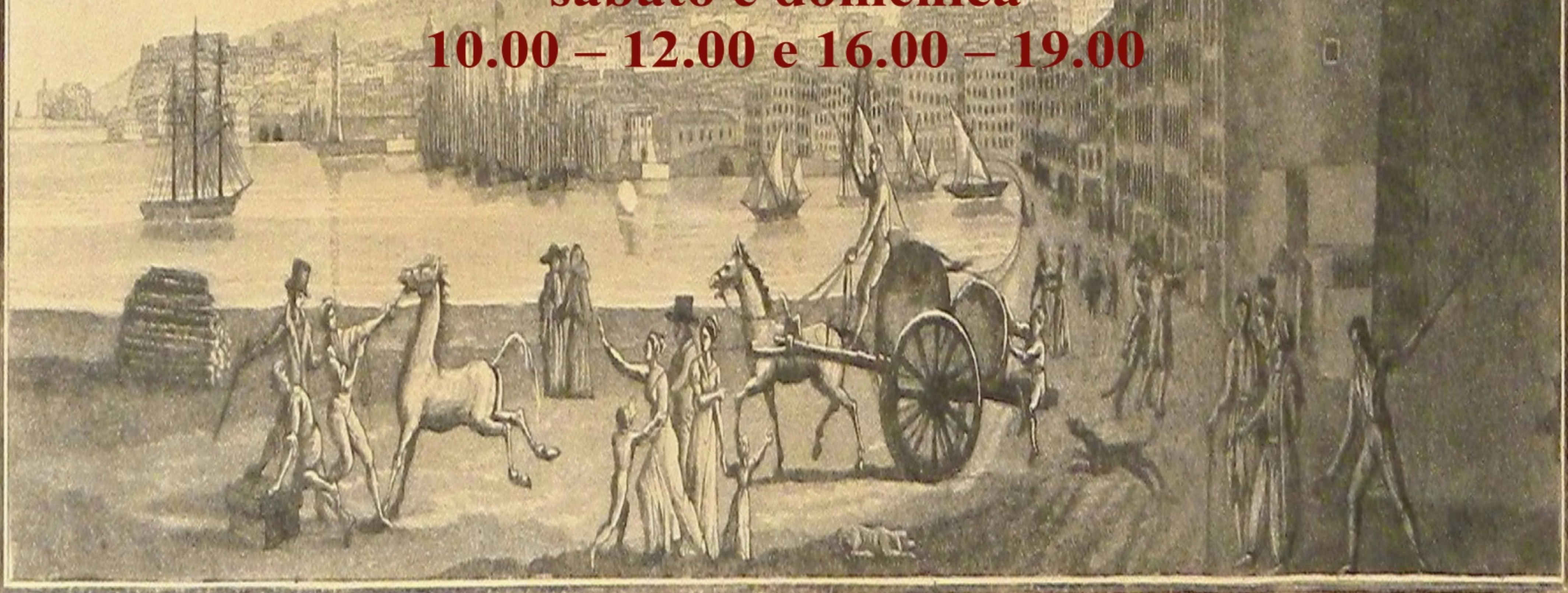
Dessin de vue en 1824.

Orario di apertura sabato e domenica 10.00 – 12.00 e 16.00 – 19.00