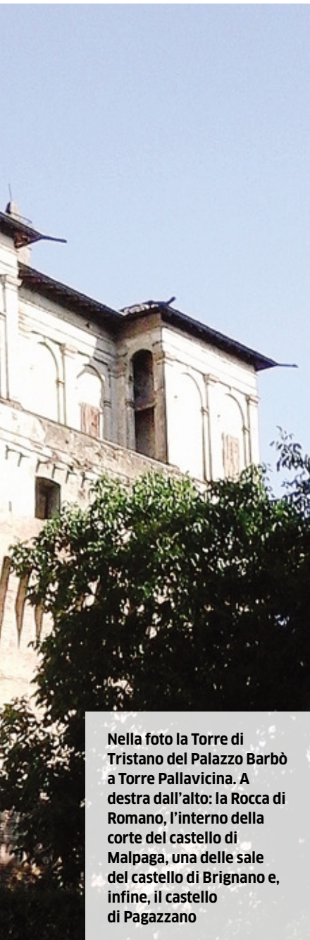
Nella foto la Torre di Tristano del Palazzo Barbò a Torre Pallavicina. A destra dall'alto: la Rocca di Romano, l'interno della corte del castello di Malpaga, una delle sale del castello di Brignano e, infine, il castello di Pagazzano