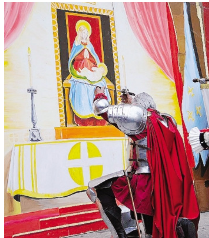
L'atto della deposizione delle armi di fronte al quadro della Madonna

Domenica «Miracol si grida» sarà anticipato, alle 14 nel centro storico, dalla ricostruzione dei mestieri medievali. Un'ora più tardi il via alla sfilata, alla recita dei figuranti e alla rivisitazione dell'evento con l'entrata in scena dei quattro