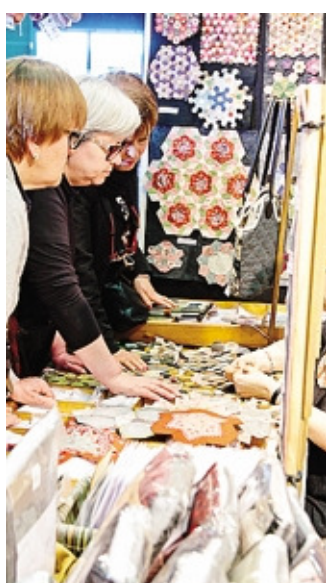
Curiosità agli stand ZANCHI

In caso di maltempo sarà rimandata di una settimana.