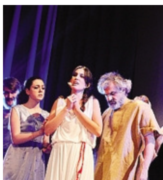
Gli attori del Teatro Si in una scena dell'«Odissea»

progetti di inserimento per persone disabili e legati alla didattica delle scuole. «Odissea, il ritorno» affronta le peregrinazioni di Ulisse durante il suo decennale girovagare per mare e il suo tanto sospirato rientro nell'amata Itaca dopo la guerra di Troia. Sopravvissuto alle ostilità degli dei, Ulisse affronta ciclopi, sirene, le insidie di Scilla e Cariddi e le perfide lusinghe della maga Circe. Lo spettacolo propone coreografie articolate, portate in scena da uno specifico corpo di ballo.