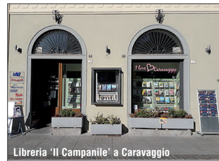
Libreria 'Il Campanile' a Caravaggio

Caravaggio ospiterà in questi tre giorni - sino a domani, domenica 1° ottobre - affermati artisti provenienti da gran parte delle regioni italiane e, tramite un interscambio culturale Italia/Brasile, due artisti brasiliani di Recife e Rio de Janeiro: sono espositori con vasto curriculum artistico, d'anni sulla scena artistica internazionale, ma anche