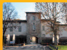
Cologno al Serio