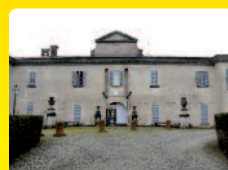
Calcio - C. Ilo Oldofredi