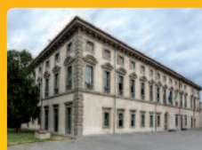
Brignano G. d'A.