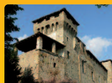
Romano di L.