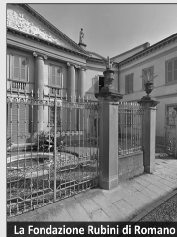
La Fondazione Rubini di Romano

I biglietti prenotati vanno ritirati entro le ore 20.40 nella serata dello spettacolo. Entrata del Teatro dall'accesso pedonale dalle cerchie di via Mons. Rossi, Fondazione Opere Pie Riunite Giovan Battista Rubini (Romano di Lombardia)