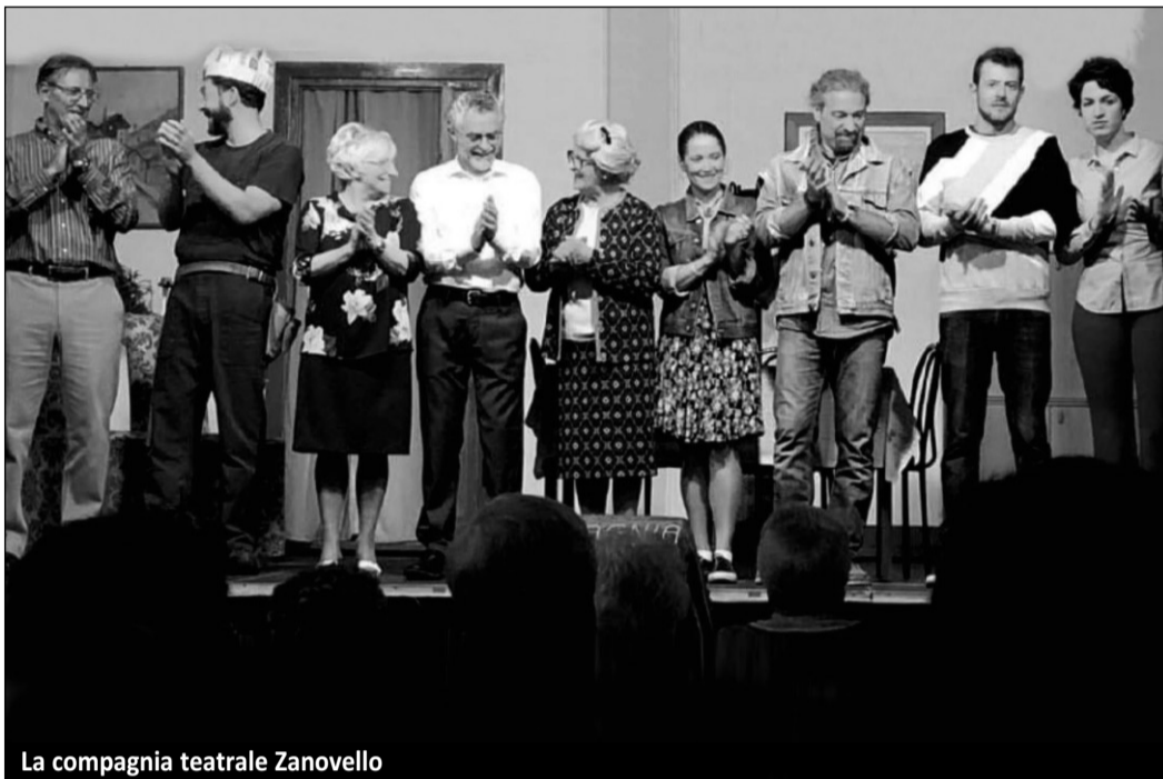
La compagnia teatrale Zanovello